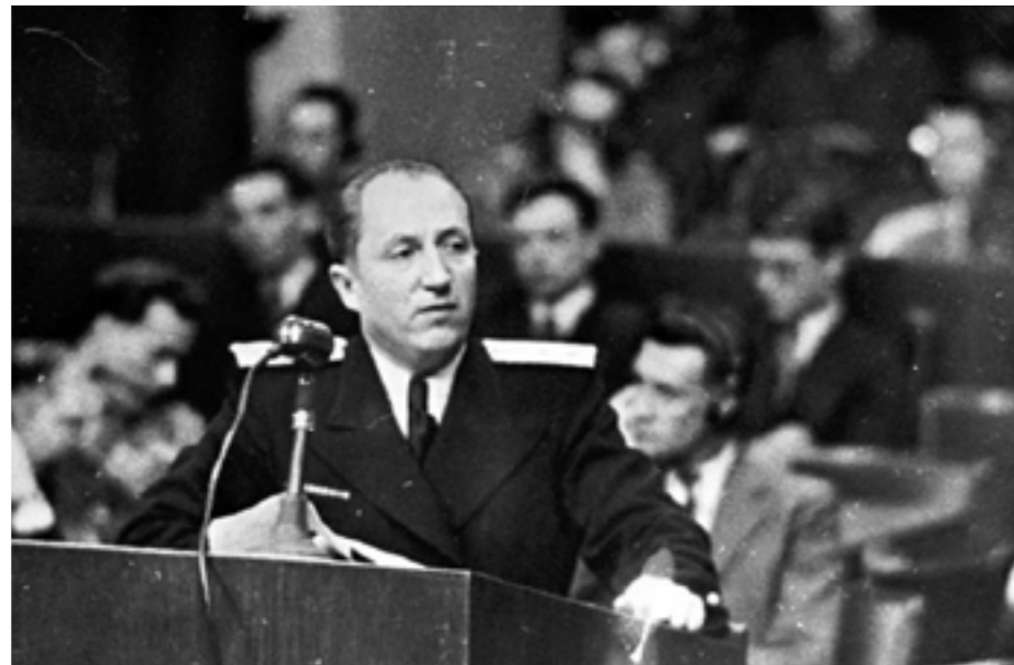
Роман Андреевич Руденко — гос обвинитель от СССР на Процессе

Процесс длился 10 месяцев, было проведено 403 слушания, допрошено 116 свидетелей, рассмотрены многочисленные письменные показания и вещественные доказательства. Из-за обострения отношений Советской стороны с Западом, процесс едва не завершился провалом, этому способствовала, в частности, Фултонская речь Черчилля, особенно обострившая сложные отношения между участниками. Однако умелые действия со стороны советского обвинения, в частности, демонстрация кинохроники военных лет, отснятой фронтовыми кинооператорами в концентрационных лагерях Майданек, Заксенхаузен и Аушвиц устранили имеющиеся сомнения трибунала.